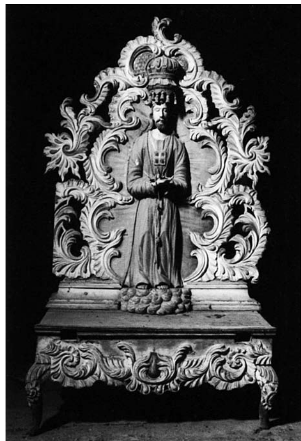
Žemaičių Naumiesčio bažnyčios Jėzaus Nazariečio ir Sopulingosios Dievo Motinos procesijų altorėlis. Lietuva. XVIII a. paskutinis ketvirtis