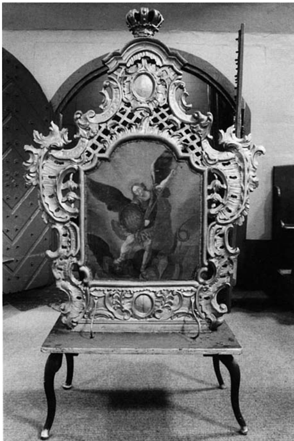
Tabariškių bažnyčios šv. Mykolo Arkangelo ir Švč. Mergelės Marijos Škaplierinės procesijų altorėlis. Lietuva. XVIII a. antroji pusė

Maldingųjų kelionių meninio apipavidalinimo aptarimą autorė veikiausiai šmaikštumo dėlei pradeda nuo įrašo vienos arkibrolijos XVII a. pajamų ir išlaidų knygoje apie išlaidas maistui, ruošiantis kelionei į Kalvariją (jautienai, veršienai, duonai, medui, alui) (p. 81–82). Nors gerokai vaizdingesnis toliau pateikiamas eisenos į Trakus aprašymas, iš kurio sužinome, kad Penkių Kristaus žaizdų brolijos nariai vilkėdavę baltos ir raudonos spalvos apsiaustus su gobtuvais, o ant galvos užsidėdavę veidą dengiančius gobtuvus su skylutėmis akims (p. 82–83). Ne mažiau išpūdingas ir procesijų pasisveikinimo paprotys, kai į Šiluvą ar Žemaičių Kalvariją